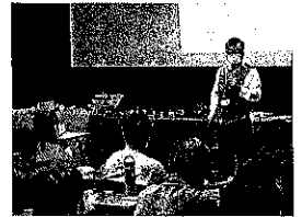
(特定化学物質及び四アルキル鉛等作業主任者技能講習風景)

注: FAXで仮申込みされた方は速やかに「正式申込書」に受講料を添えて当協会にお申し込み下さい(電話による申込みは、受付していません)。尚、7営業日前まで受講料が納付されない場合、キャンセルと見なします。